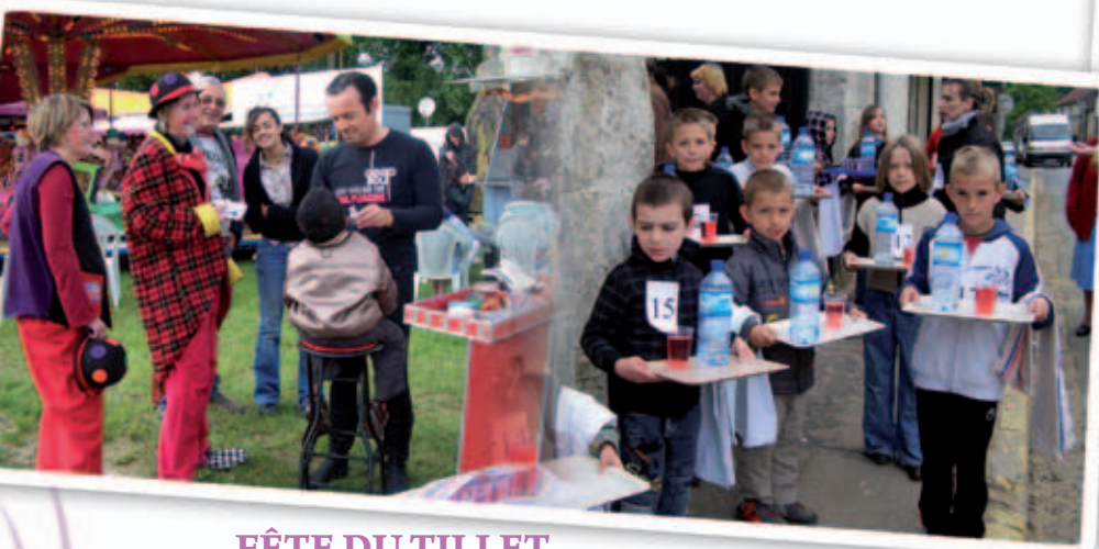
FÊTE DU TILLET