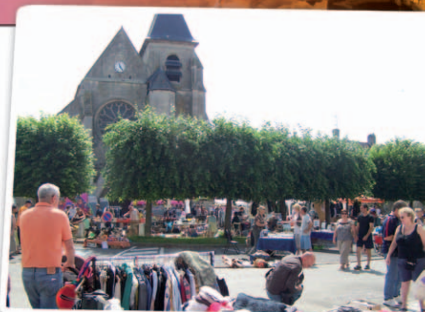
BROCANTE DE JUILLET