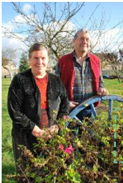
Bénévoles à l'embellissement de la commune