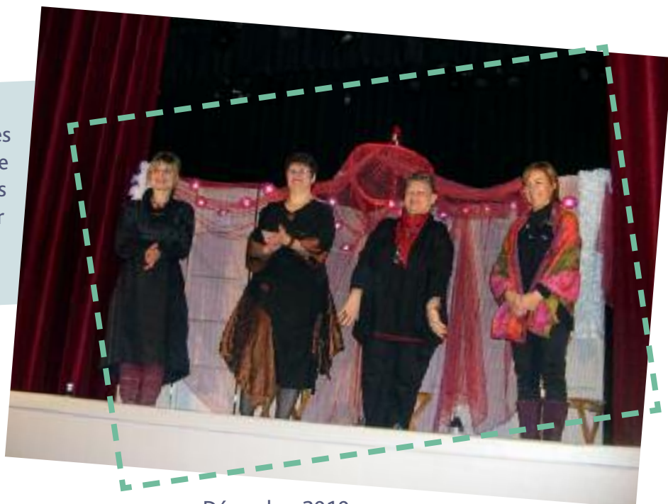
Décembre 2010: spectacle contes à Saint-Lager

Depuis l'an dernier, en fin d'année, les bibliothèques de la communauté de communes vous proposent, dans leurs villages, des spectacles de contes, pour enfants et adultes.