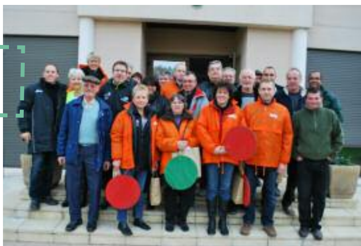
Participants au marathon 2011