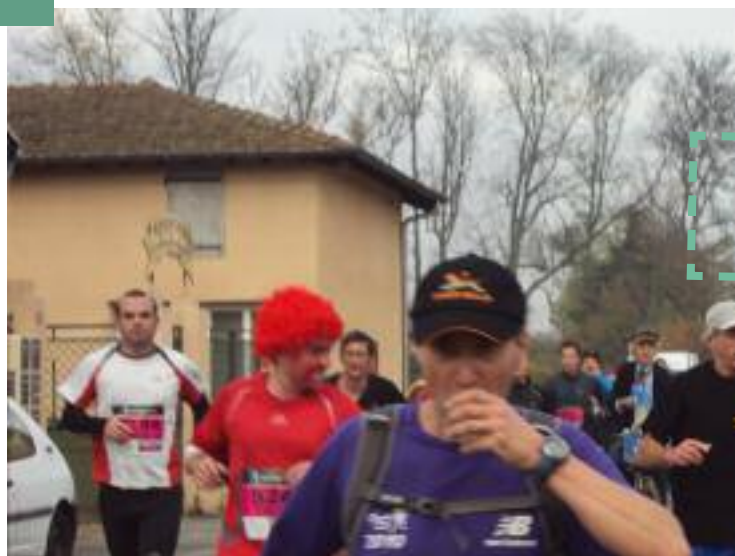
Bénévoles du marathon 2011