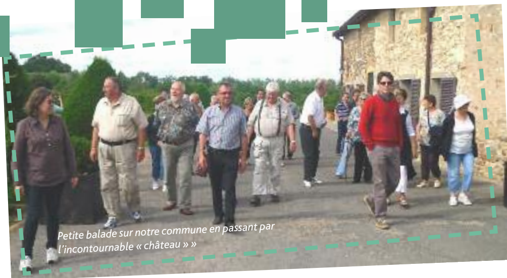
Petite balade sur notre commune en passant par l'incontournable « château »