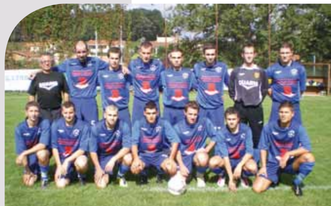
Seniors 1 er Tour Coupe du Rhône 2011-2012

La saison 2010-2011 s'est clôturée de la plus belle des manières en fêtant le cinquantenaire du football et du handball club de Denicé. Plus de 600 personnes se sont réunies pour se remémorer leurs belles années. Cette manifestation s'est déroulée autour du nouveau complexe sportif.