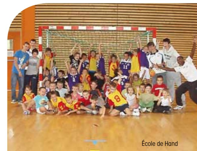
École de Hand