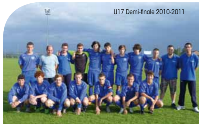
U17 Demi-finale 2010-2011

Même son de cloche pour les plus jeunes : les U19 finissent 4 èmes de 1 ère division avec un effectif réduit dû à la restructuration de l'équipe. Les U17 finissent 5 ème de leur championnat et finaliste de la Coupe du Beaujolais. Les U15 terminent dans la 1 ère partie de tableau.