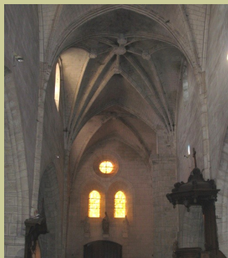
Saint Médard, Saint Nicolas XVIIème siècle, Saint Louis, XIXème siècle.

Très connu des paysans, Saint Médard est important pour les récoltes. Ne dit-on pas que s'il pleut à la Saint Médard, il pleut quarante jours plus tard ?