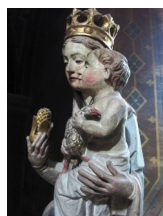
Vierge à l'Enfant polychrome du XVI ème siècle.

La cloche « Louise-Marie » est datée de 1672, elle a été attribuée à la commune en 1793 après que le citoyen maire Hénin ait laissé réquisitionner la vieille cloche fêlée par le représentant du peuple : Couturier, pour alimenter les besoins en métaux de la Révolution, elle provient de l'église Saint Basile d'Étampes. « Louise » est datée de 1658, c'est celle du Prieuré de Saint-Hilaire, désaffecté après la Révolution. La cloche « Antoine-Cécile » est datée de 1891, elle fut donnée par Henri Masse de Combles, châtelain et maire-adjoint du village, tandis que la dernière cloche qui ne porte pas de nom fut donnée par les paroissiens de Châlo et Saint-Hilaire.