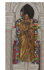
Vierge en bois doré, 1858

néo baroque XIX ème , avec escalier à double révolution. Face à la chaire, banc d'œuvre