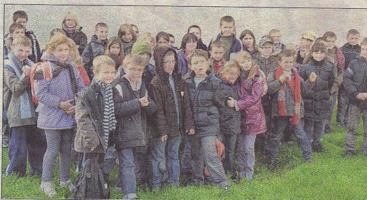
Une journée riche en enseignements.