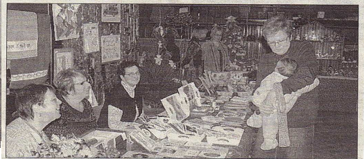
Il y en avait pour tous les goûts à ce marché de Noël.