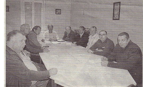
L'assemblée générale du Braquet aura lieu le 14 novembre.