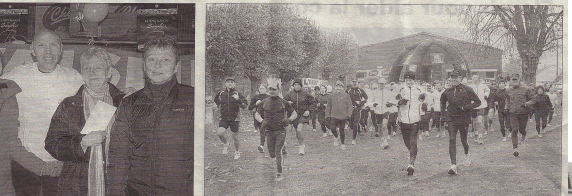
Domigny a remporté le séjour dans le Beaujolais. Malgré le froid, ils étaient cent quarante-deux pour le footing de 10 km.