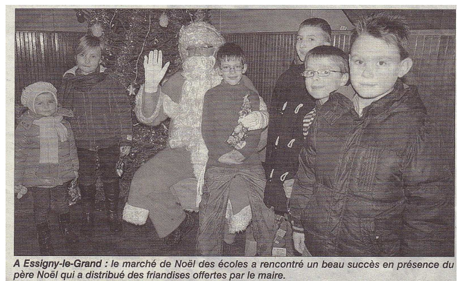
A Essigny-le-Grand : le marché de Noël des écoles a rencontré un beau succès en présence du père Noël qui a distribué des friandises offertes par le maire.

les enfants qui ont apprécié cette journée très riche en enseignements. Des connaissances supplémentaires qui permettront aux enseignantes de poursuivre ce travail en classe. Pour cette sortie, l'ensemble du corps enseignant remercie les parents accompagnateurs.