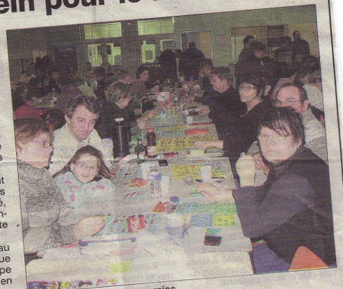
Les tables étaient bien garnies.

Ce succès va permettre au club d'envoyer, comme chaque année, des jeunes à la coupe de France qui se déroulera en avril à Miramas, près de Marseille.