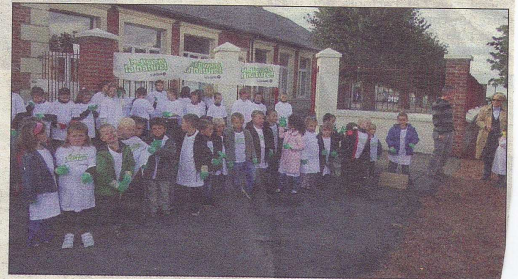
Les enfants ont ramassé douze kilos de déchets dans la commune.

Après le ramassage, les enfants se sont retrouvés sous le préau pour un goûter bien mérité.