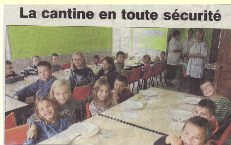
Aller à la cantine ne sera plus dangereux pour les enfants.

En fonction de l'évolution du nombre d'enfants, des aménagements complémentaires seront effectués.