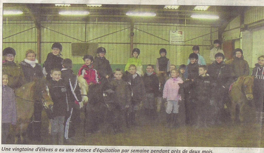
Une vingtaine d'élèves a eu une séance d'équitation par semaine pendant près de deux mois.

De leur côté, les élèves regretteront déjà la fin des séances d'équitation.