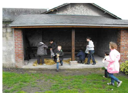
La course vers le préau !