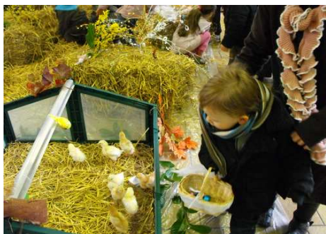
Les plus petits étaient très intéressants par les poussins !