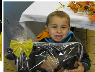
Les trois gagnants du tirage au sort !