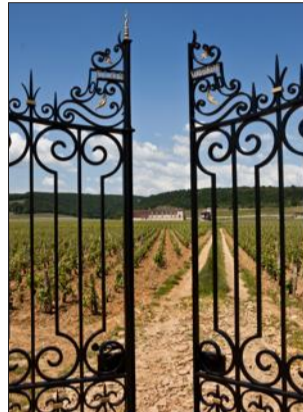
Le Clos Vougeot vu par Armelle Hudelot, l'une des jurés du concours.

Labellisé Semaine des climats, le rendez-vous s'inscrit aussi dans le cadre des Journées du fait main organisées par le site d'e-commerce allitlemar-