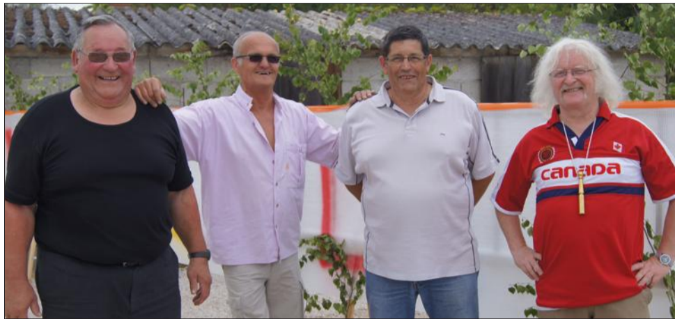
Joël, Georges, Joël et... Joël.

H istoire peu banale que ces quatre compères qui décident de fêter leur départ en retraite. Quatre "Jojo", adolescents à l'époque des Beatles et qui pourraient aujourd'hui chanter en chœur : All Together Now (Tous ensemble maintenant). Trois d'entre eux s'appellent Joël et tous trois ont travaillé ensemble à Tyco Electronics Simel, usine de fabrication de matériel de distribution et de commande électrique basse tension, installée à Gevrey-Chambertin.